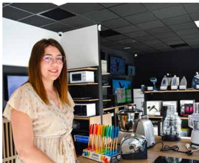
Extra - 1204 Avenue Marcel Mérieux www.marcy-lettoile.extra.fr - 04 78 48 53 72