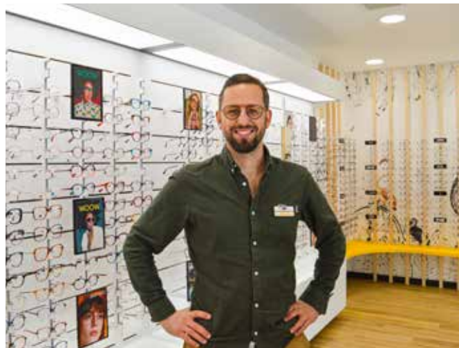
Optic 2000 - 1170 Avenue Marcel Mérieux marcyletoile@optic2000royer.fr - 04 28 44 10 54